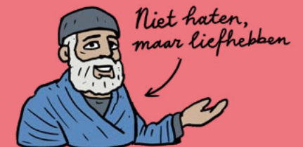
Niet haten, maar liefhebben