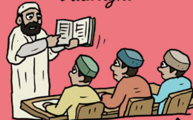
Verplicht Koran-les →