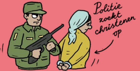
Politie zoekt christenen op